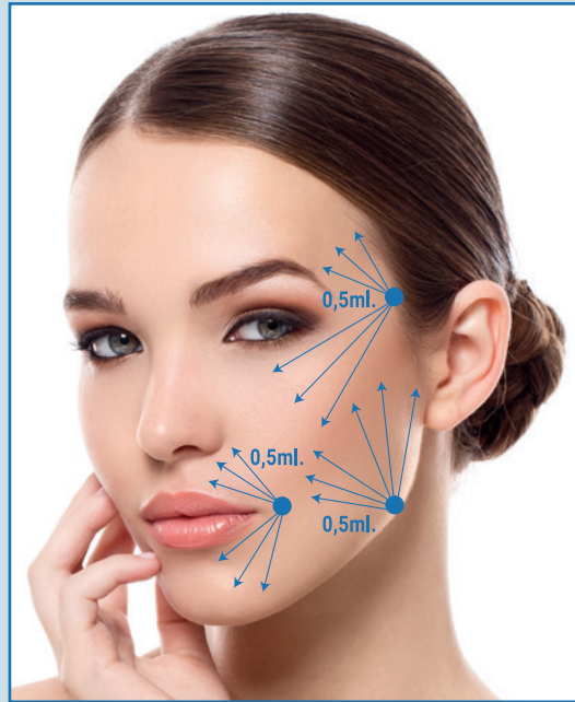
2ª sesión : 1 jeringa de 3ml