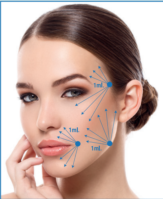
1ª sesión : 2 jeringas de 3ml